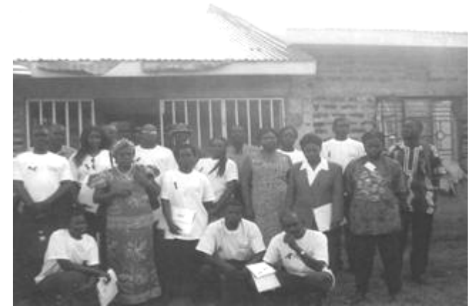
Gruppenbild nach Abschluß des Workshops

Damit wir unser Wissen erweitern und auch andere junge Leute Experten im Umgang mit AIDS werden können, sind noch viele Workshops nötig. So bekämpfen wir AIDS!“